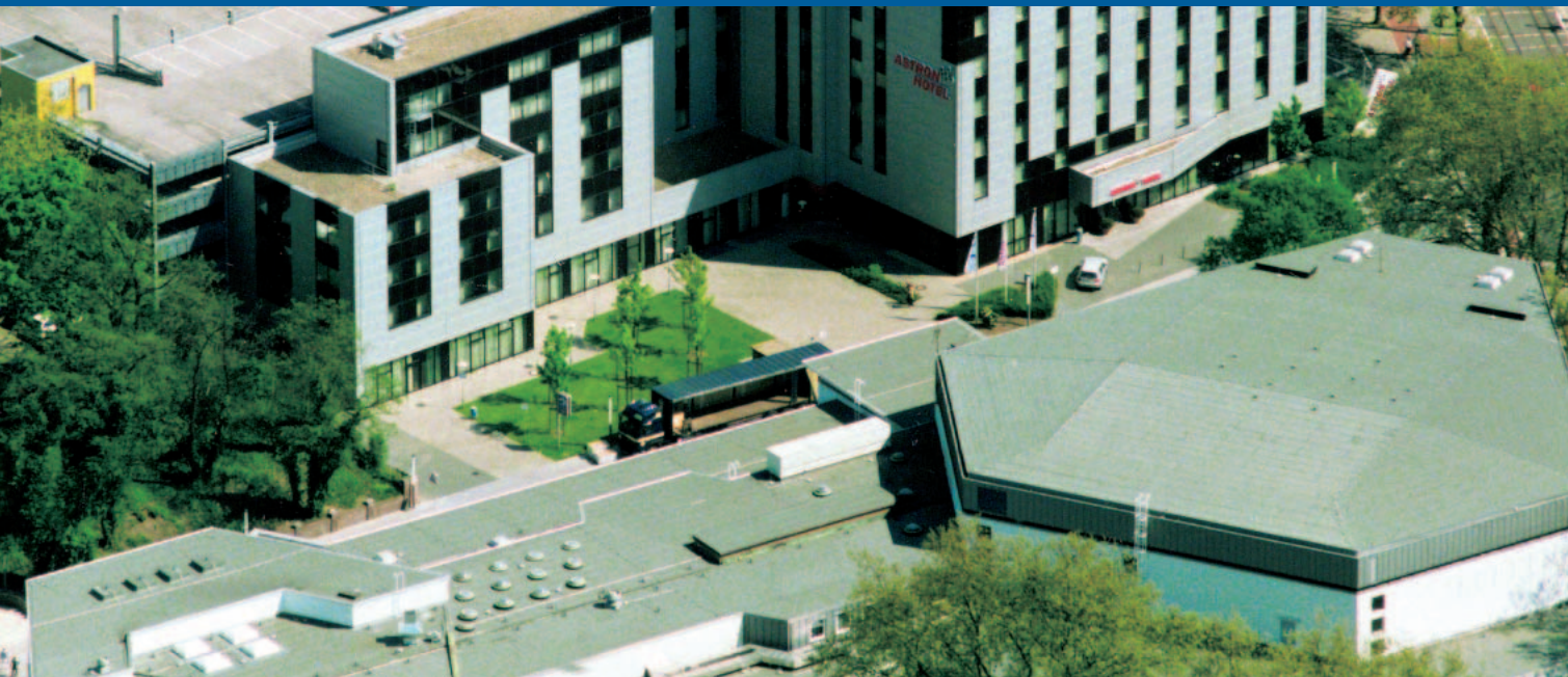
Das Kongresszentrum Oberhausen: Veranstalten im Herzen des Ruhrgebiets